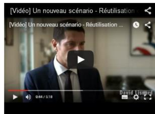
ASSAINISSEMENT - RÉUTILISATION DES EAUX USÉES - GESTION DES SERVICES D'EAU ET D'ASSAINISSEMENT > JEUDI 05 NOVEMBRE 2015

Signature d'une convention de partenariat entre EDF et l'agence de l'eau Rhône Méditerranée Corse.