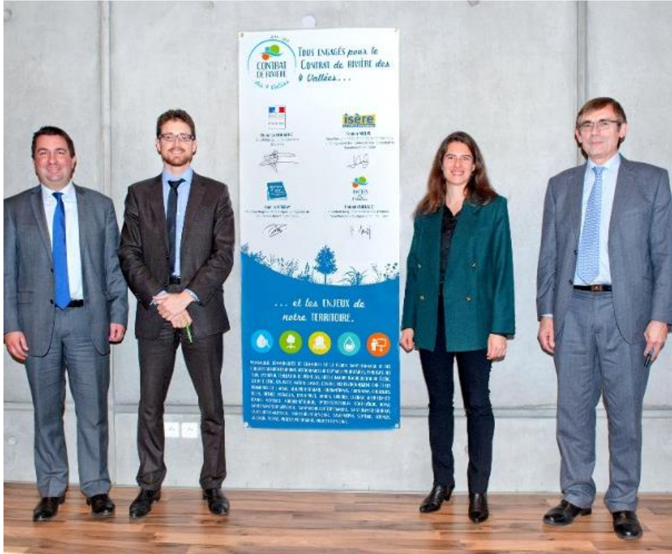
QUALITÉ DES EAUX ET SANTÉ - BIODIVERSITÉ - RESTAURATION ÉCOLOGIQUE - GOUVERNANCE - CONTRAT DE MILIEU - GESTION DE L'EAU - GEMAPI