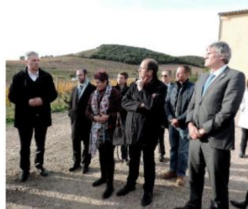
QUALITÉ DES EAUX ET SANTÉ - PESTICIDES - PROTECTION DES CAPTAGES > VENDREDI 27 NOVEMBRE 2015