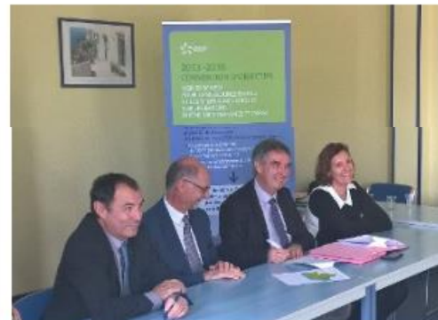
> MARDI 24 NOVEMBRE 2015

Produire sans herbicides, vers un modèle économique pérenne pour l'agriculture.