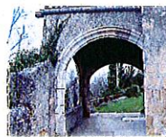
Porche de l'église