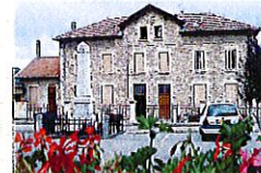
Monuments aux morts et Ancienne école