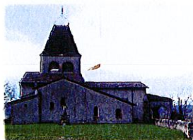
Eglise du XIème siècle