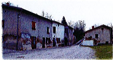
Dernières maisons de l'ancien village sur la place de l'église